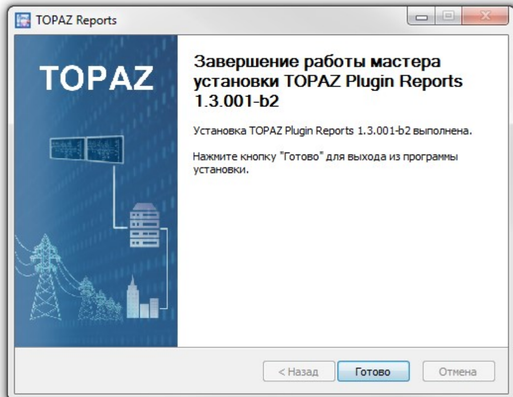
Рисунок 3 – Окно завершения работы мастера установки TOPAZ REPORTS