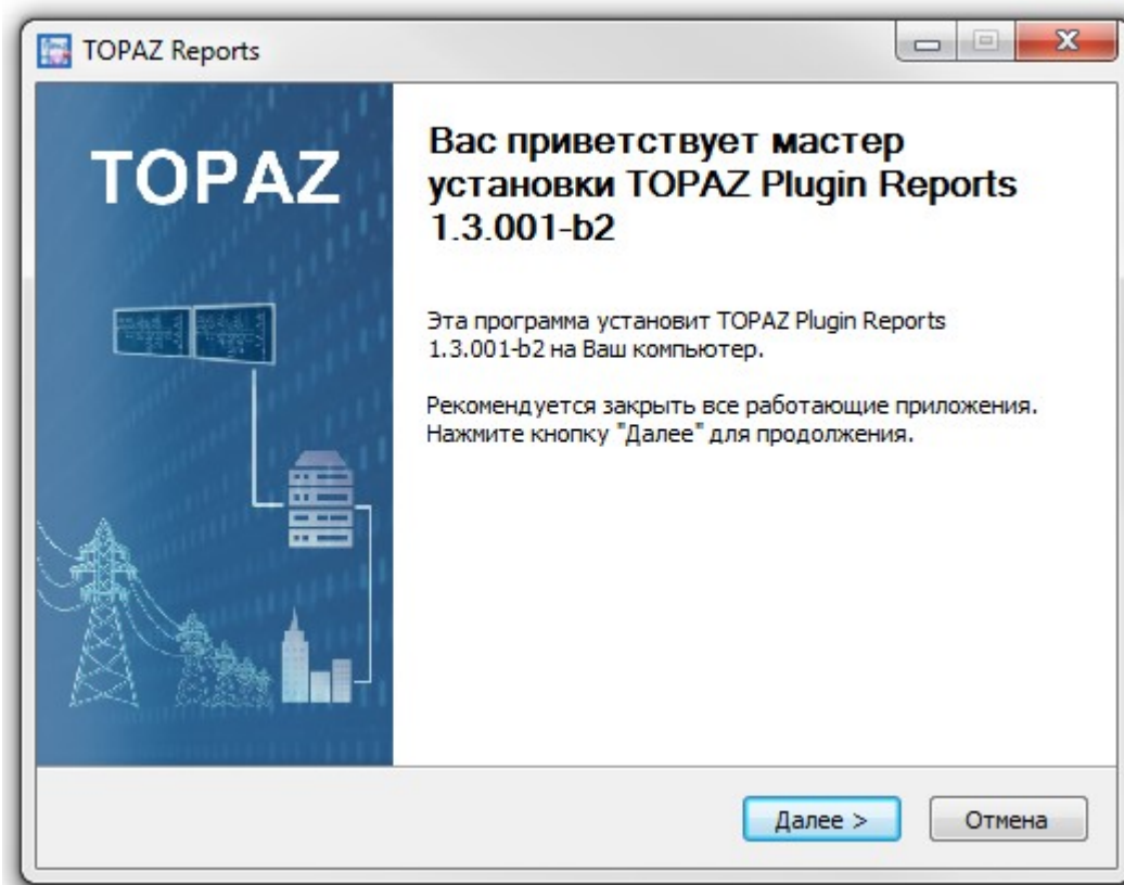
Рисунок 1 – Окно приветствия мастера установки

Для установки компонента требуется установить дистрибутив TOPAZ_Plugin_REPORTS_X.X.X.exe , где X.X.X-текущая версия дистрибутива.